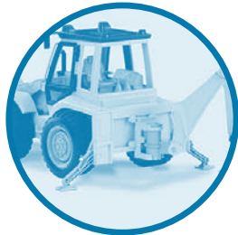
Folding support legs Système de support pliant