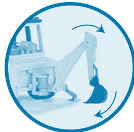
Rear excavating arm Bras d'excavation arrière