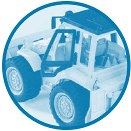
Doors open Les portes s'ouvrent