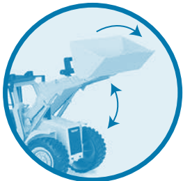
Shovel pivots La pelle pivote